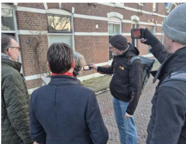
Foto: welke uitdagingen hebben we in Assendorp? Samen met de gemeenteraad op zoek naar warmtelekken.