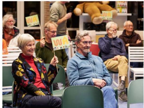
Foto: tijdens de ALV stemmen leden van de coöperatie over belangrijke onderwerpen

Tijdens de ALV en bewonersbijeenkomst hebben we teruggekeken op het eerste coöperatiejaar en de afgelopen straatgesprekken met de schafkreet. Belangrijkste conclusies; de randvoorwaarden zijn nog steeds actueel en ook de bewoners uit het vergrote plangebied willen samen onderzoeken of een coöperatief warmtenet past in onze buurt. De kascommissie en de penningmeester hebben uitleg gegeven over de financiële stand van zaken. Ook keken we vooruitgekeken naar het voorlopig ontwerp, een mooie nieuwe bron voor de warmte en de ambitie om, stap voor stap, heel Assendorp te voorzien van duurzame warmte. Lees meer over de ALV op onze website.